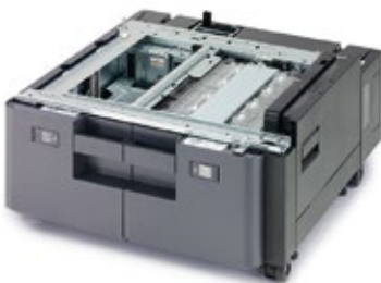
2 x 1.500-BLATT-PAPIERKASSETTE PF-7110 Unterstützt A4, B5 und Letter-Formate.