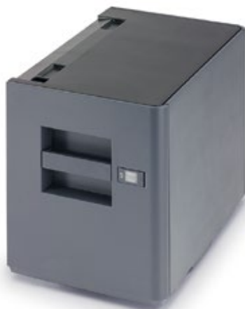
3.000-BLATT-PAPIERMAGAZIN PF-7120 Ideal für hochvolumige Jobs in A4.