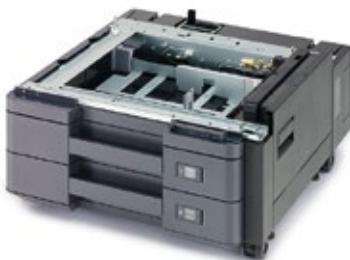
2 x 500-BLATT-PAPIERKASSETTE PF-7100 Ideal für Papierformate zwischen A6 und SRA3 (320 mm x 450 mm).