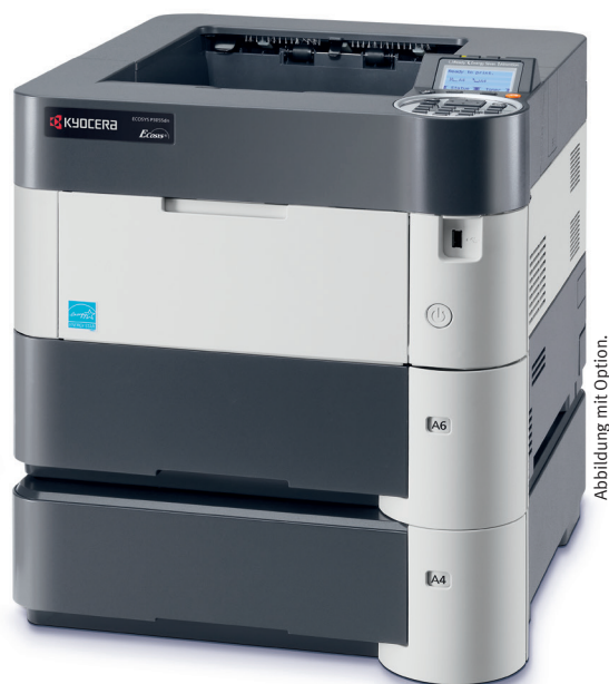
Abbildung mit Option.